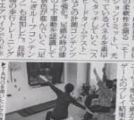
作業効率化の一例

レクの作業時間軽減には、PT（作業療法士）の監修によるプログラムが効果的です。お客様の作業環境やスキルに合わせて最適なプログラムを提供いたします。